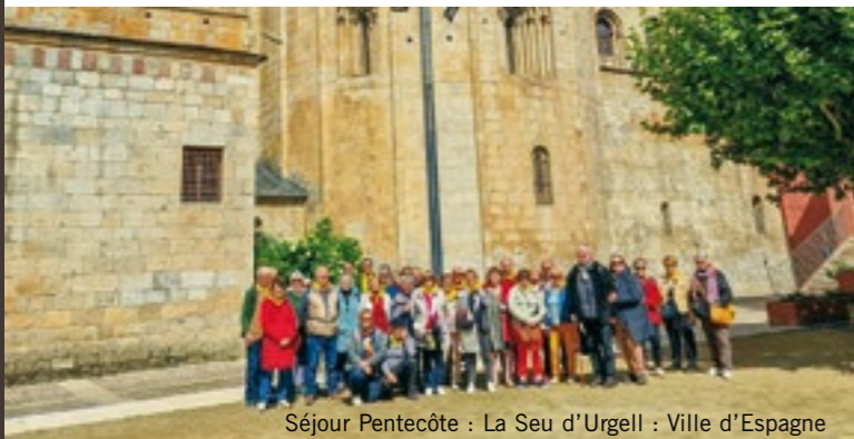
Séjour Pentecôte : La Seu d'Urgell : Ville d'Espagne